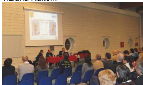
Clinic "IL DELFINO" Auditorium GE-TUR